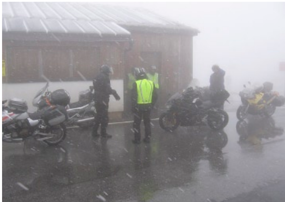
Snestorm Timmelsjoch-passet i juni måned