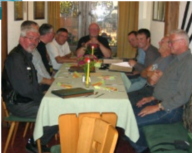
Læs Johns beretning om Btedy, snevejr og en enkelt Radler på Dolomittur 2008