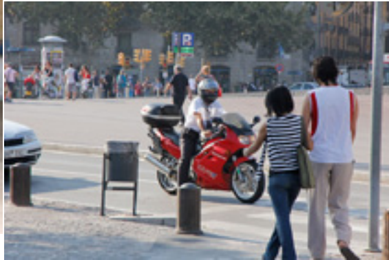
I Barcelona har man et meget afslappet forhold til sikkerhedspåklædning. Her en VFR-chauffør i hvid skjorte og slips !