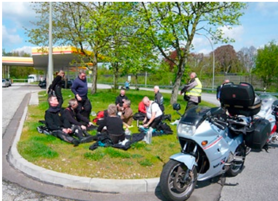
Fossiler på vej til Harzen