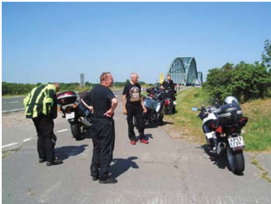
Fossiler på indkøbstur syd for grænsen