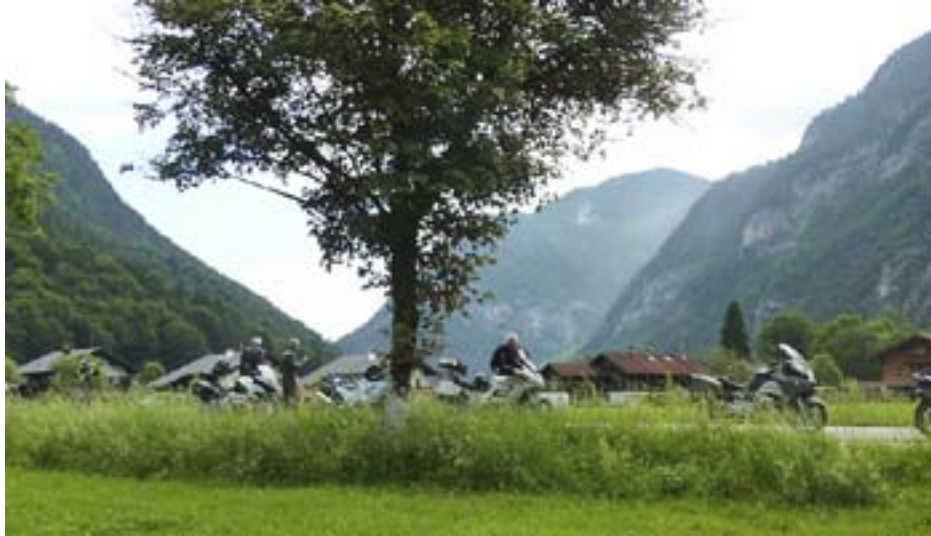
Pauser er vigtige når man er på tour. Se mere om Oberaudorf-turen side 5