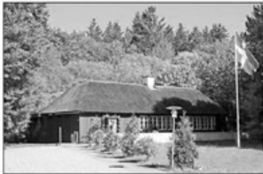
MOSSKOV PAVILLONEN - en Afd. Slev træden-

besøge ”Tingbæk Kalkminer” Tingbæk Kalkminer har været åben for besøgende siden 1930.