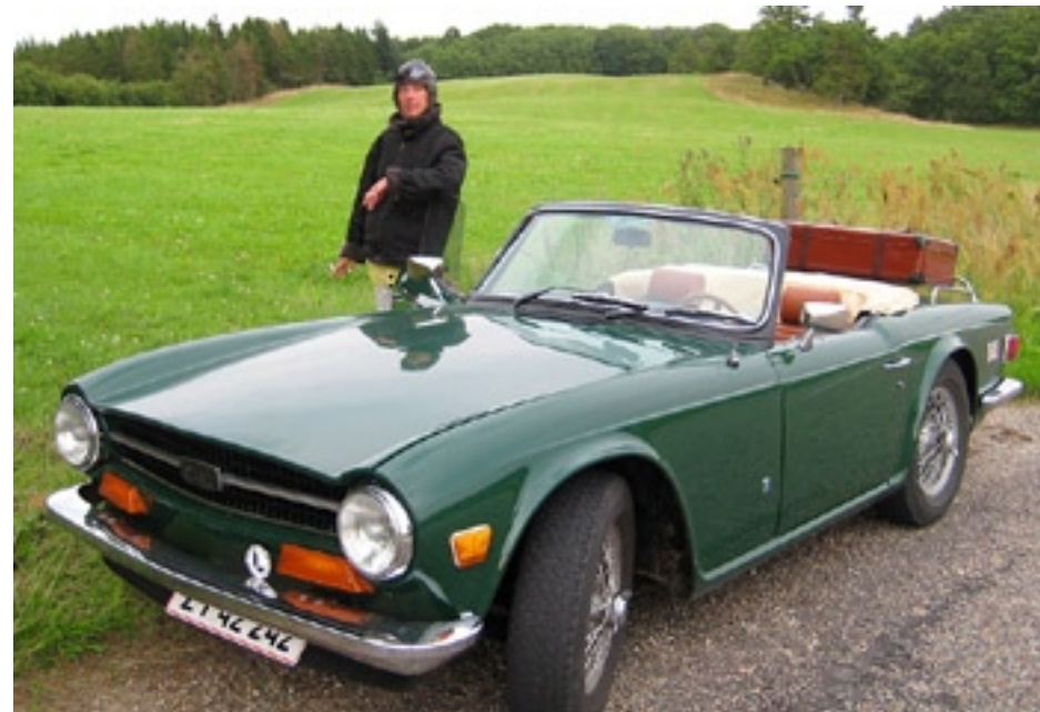
Nogle kører 4 hjul mens rigtige fossiler kører på 2 hjul :-)