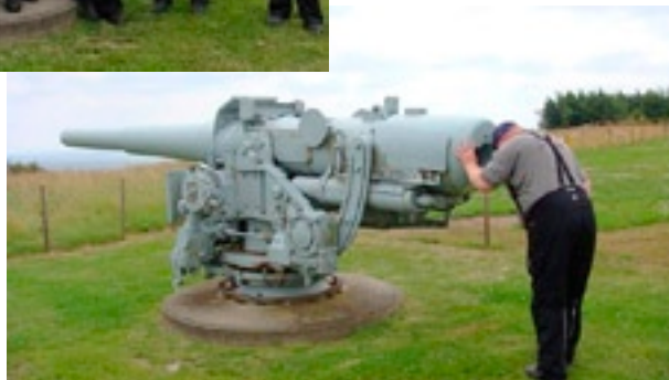
Se flere billeder og turberetninger inde i bladet eller på vores hjemmeside