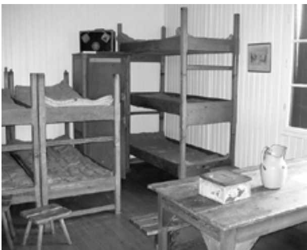
15 mands-stue i Frøslev

I øsregn, gik det videre langs østkysten, og især Løgt-land er meget flot, med gl. huse og gårde med stråtag, næsten alle sammen. Frøslev-lejren er også et besøg værd. Det er ligesom at komme tilbage til den tid i 1944-45, når man befinder sig i bygningerne. Her er udførlige beskrivelser og beretninger om deres "meritter" i en meget grå tid.