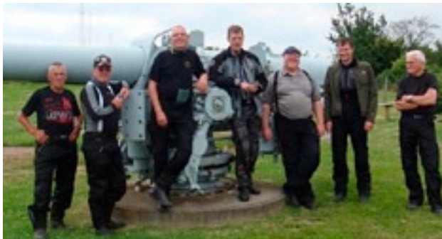
Glimt fra nogle af sommerens udflugter i MC-Fossilerne